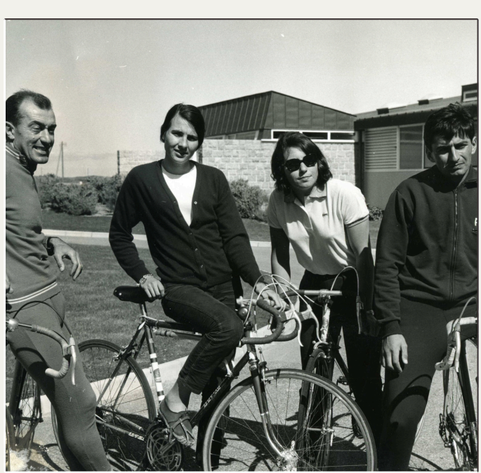
Promenade Louison Bobet

L'histoire de la Thalassothérapie de Quiberon a commencé il y a 60 ans. Le 11 mai 1964, Louison Bobet inaugure l'Institut et fonde alors le premier institut de thalassothérapie moderne.