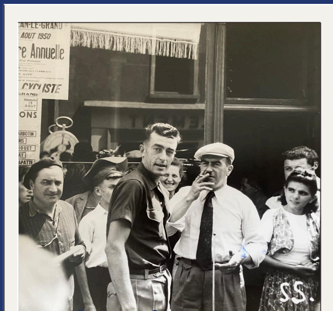
Palais des Congrès Louison Bobet

Le musée de Quiberon rend hommage à ce grand sportif au palmarès incroyable. Toute sa vie y est retracée, tandis que sont exposés son vélo d'entraînement, son maillot de l'équipe de France et son maillot de champion du monde de 1954.