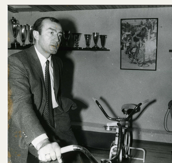
Maison du Patrimoine