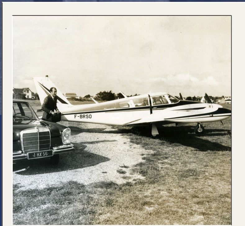
Aérodrome de Quiberon

Louison Bobet passionné par l'aviation, crée sa propre compagnie aérienne "Thalass Air" pour transférer les clients et stars de l'époque à la Thalassothérapie.